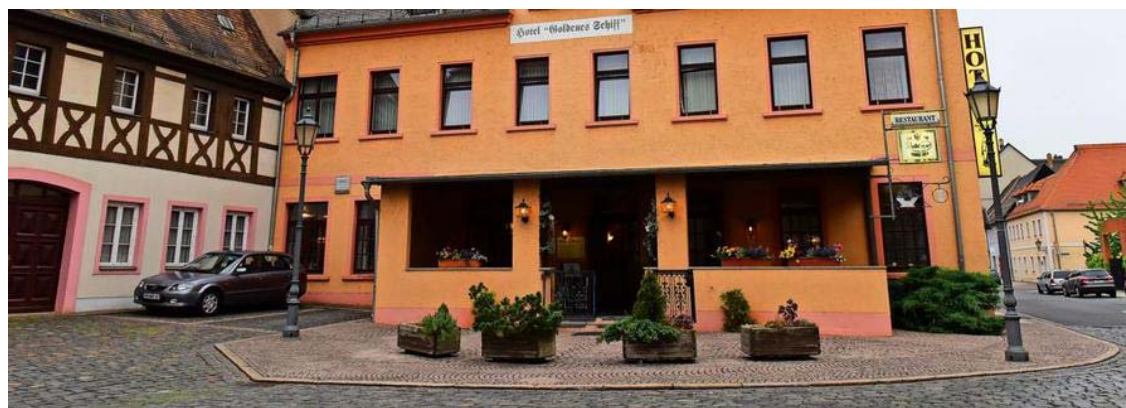
Im Hotel Goldenes Schiff am Leipziger Platz tagen die Unternehmer und Gewerbetreibenden des BNI-Netzwerkes in Gründung.

| Artikel veröffentlicht: 04. Oktober 2017 17:11 Uhr