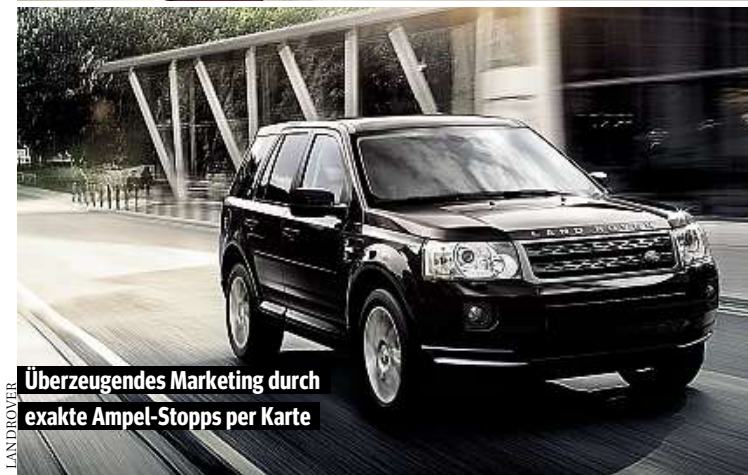
Überzeugendes Marketing durch exakte Ampel-Stops per Karte