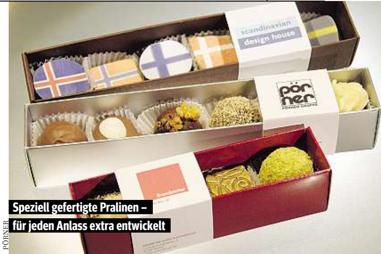
Speziell gefertigte Pralinen – für jeden Anlass extra entwickelt

Paperboy bringt Sie zu den Firmen-Webseiten www.kurier.at